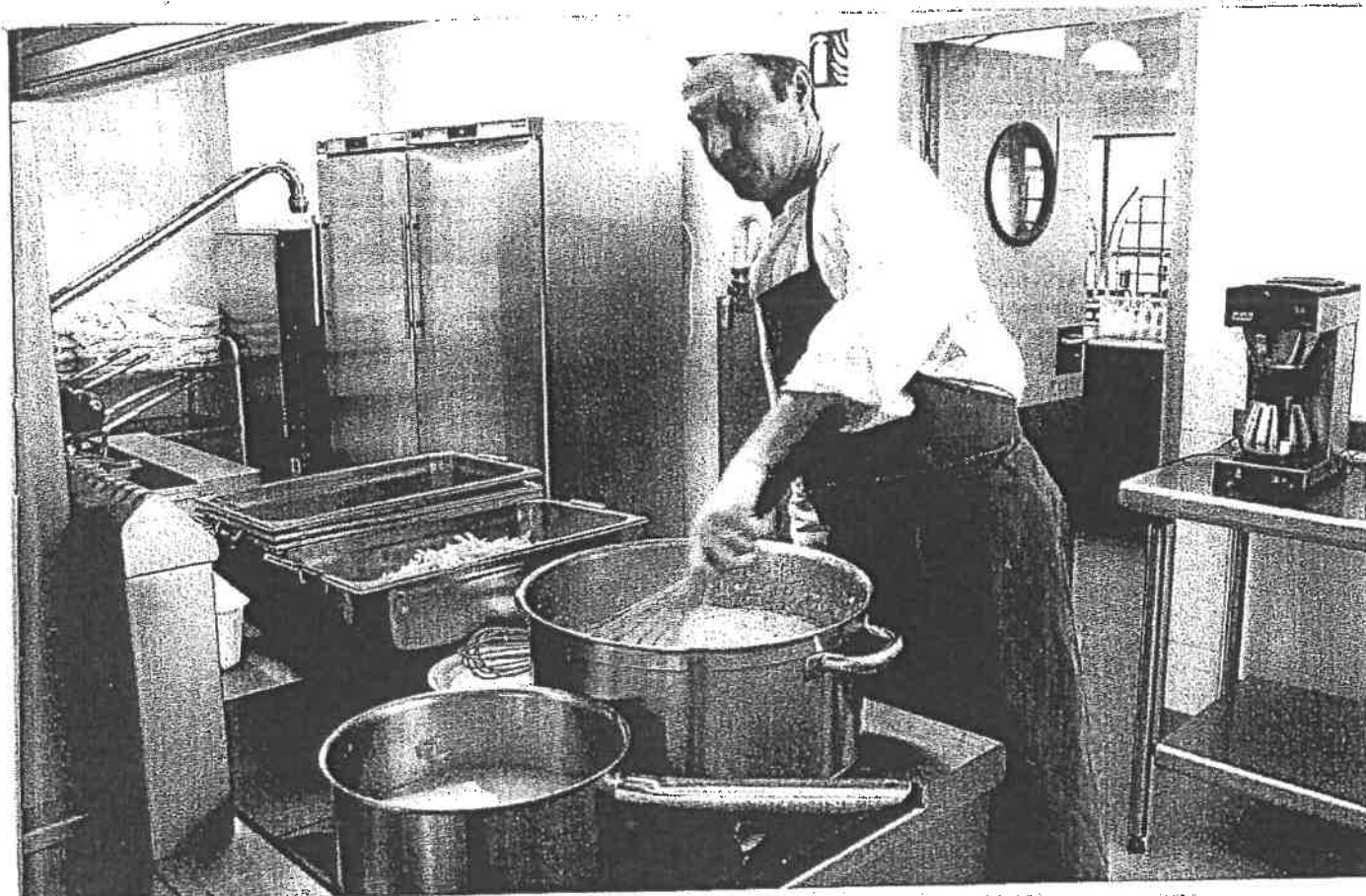
L'Isère, qui gère 96 collèges, a réduit sur plusieurs établissements le poids des pertes par repas, soit une économie d'un million d'euros.